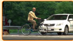
ダイジェスト篇 (約3分)