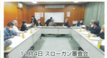
11月4日 スローガン審査会