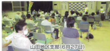
山田地区支部(6月27日)

6月27日 山田(福光)、7月8日 井波、 7月27日 吉江(福光)の各地区支部