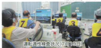
運転適性検査状況(7月19日)