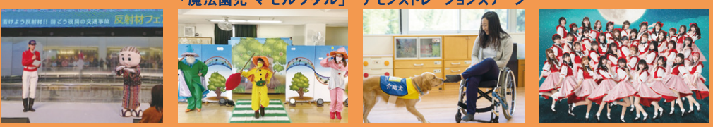
バクステ外神田一丁目

交通安全教室 JA共済 親子の交通安全ミュージカル 「魔法園児 マモルワタル」 JA共済 介助犬による デモンストレーションステージ ライブステージ