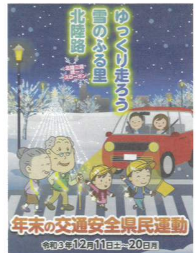
年末の交通安全県民運動 令和3年12月11日～20日

～交通安全活動及びこの広報紙は、皆様からいただいた運転者協力金・車両割賛助金等を活用させていただいております。～